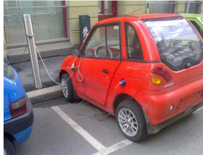
Fig 10 – Skjøteledning på ladekabel