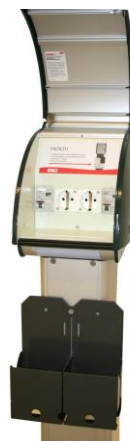
Fig 3 - Mode 2 ladepunkt Schuko med kurv for ladeboks på ladekabel