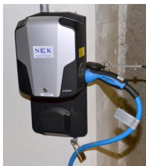
Fig 6 – Mode 3 På-vegg-lader med Type 2 kontakt