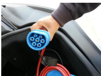
Fig 5 – Type 2 kontakt (Mennekes kontakt)

På-vegg-lader kan enten ha fast kabel som plugges i bilen eller være utstyrt med en Type 2 kontakt (bileier har egen kabel som på bildet). Normalt sikres lader med 16A eller 32A men kan også benyttes til semi-hurtiglading på 63A om effekt er tilgjengelig. Mode 3 ladeboks har innebygde sikkerhetsfunksjoner, kan utstyres med system for fordeling av tilgjengelig effekt og har mulighet for betalingsløsninger. De to siste funksjonene er spesielt aktuelle for borettslag, sameier og offentlige tilgjengelige parkeringsanlegg når kapasiteten er begrenset. Jordfeilbryter type B er ofte ikke nødvendig fordi den allerede er installert i boksen.