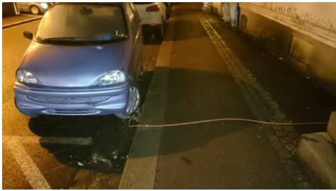
Fig 9– Kabel over fortau - langs vegg - inn vindu

Merknad: DSB erfarer at noen elbileiere legger ladekabel gjennom vindu fra bolig. Dette kan medføre livsfare og er ikke tillatt.