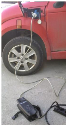
Fig 2 – Mode 2 - Vanlig kontakt – Schuko med ladeboks på ledning