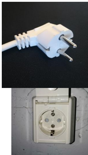
Fig 1 – Vanlig kontakt - Schuko

Ladeledningen plugges i en vanlig jordet kontakt (på fagspråket kalt Schuko kontakt). På ladeledningen henger det en boks som styrer ladestrømmen og overvåker sikkerheten. Dersom det legges til rette for lading fra en fast ladekontakt, skal kontakten forsynes fra en egen kurs med maks 10A sikring. Begrensningen gjelder ikke industrikontakt (CEE / EN 309) som brukes sjelden. Kursen skal være beskyttet av en egen jordfeilbryter av B type (blir ikke forstyrret av støy fra bilens ladesystem). Husk oppheng av ladeboks i kurv eller krok. Kontakten blir nemlig ødelagt av vekten av ladeboks og kabel.