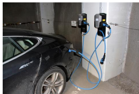
Fig 7 – Bil til Mode 3 lading med løs Type 2 kabel