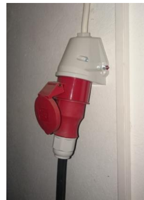
Fig 4 – CEE / EN 309 kontakt